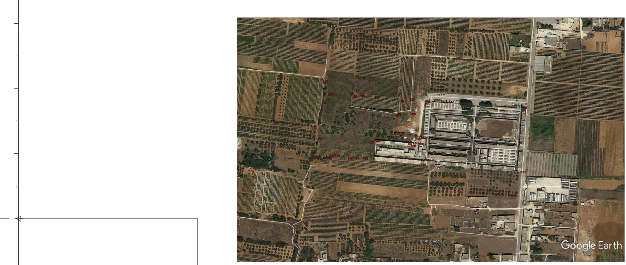
STRALCIO AEROFOTO SATELLITARE CON INDIVIDUAZIONE PUNTI DI RILIEVO