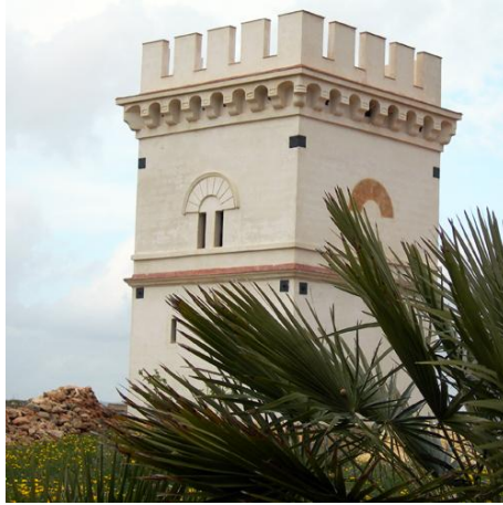
Picture 2: GalvagaTower

Another tower present in the territory of Petrosino is GalvagaTower (Picture 2). This majestic and fascinating structure was built in 1582 to dominate the countryside and to catch sight of some bandits or criminals. Each tower had a well and a waterhole and it was a small fortress where farmers and shepherds could take refuge. Realized in tuff, it is massive, squared and quadrangular. It has two floors with three rooms on each floor. Unique element of the tower is its crenellation on the top that makes the structure austere.