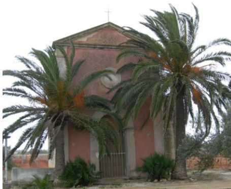
Picture 3: Milazzo Chapel, photo from: http://www.visitpetrosino.com/en/territory.html

The oldest church that was built in the territory is Milazzo Chapel (Picture 3). Located in district “contrada Torreggiano”, it was built in XVIII century as the chapel of Milazzo Family. The little church has a neoclassic facade and the interior has a nave where is placed a polychrome plaster statue of Christ.