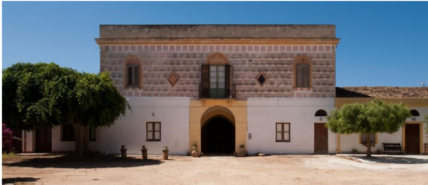
Picture 7: Baglio Spanò

The structure offers the comfort of a modern structure and at the same time keeps the distinctive elements of the old Sicilian house unchanged.