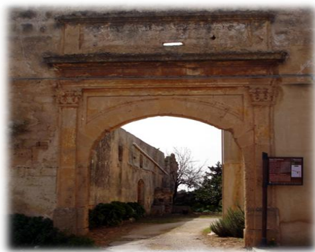
Picture 4: BAGLIO WOODHOUSE

It is the first Baglio used as winery, a luxurious neoclassical villa with a strong artistic value, built in 1813 by John Woodhouse (the English merchant who discovered the wine "Marsala" and exported it all over the world). A testimony of the ancient splendor of this Baglio now remain, in addition to the entrance portal (Picture 4), only a few elements original and frescoes depicting vine leaves, in the upper floor.