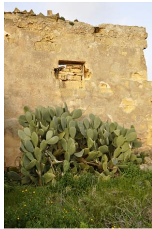
Picture 6: Baglio Don Federico, photo from: https://fluidmatter.org/2013/03/07/baglio-don-federico/

Norman domination, it was granted to the bishopric of Mazara. In 1862 it was assigned to the public auction of Don Federico Spanò. It has an almost quadrangular plan with a single and monumental entrance with a round arch in tufa stone blocks (Picture 6). The entrance consists of a quadrangular environment with a barrel vault now completely collapsed. On the west side, to the right of the entrance, the perimeter wall was destroyed. The perimeter wall of the left side is intact and well preserved. In the quadrangular courtyard, all the rooms, warehouses and houses overlook. The presence of a well, now covered with tuffs, characterizes the internal quadrangular court. The warehouses along the South side also collapsed and constituted the old part of the services. A cornice at the top, still evident on the west side and partly on the south side, followed the perimeter walls of the baglio. Baglio Don Federico should be recovered and reinserted in the historical memory of Petrosino as an indelible mark of its past that should not be forgotten, it also represents a natural background to the main street, Via Baglio.