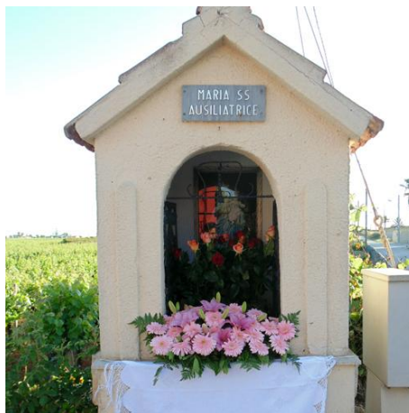
Picture 1: “Fiuredda” (sacred aediculae)

Going through the streets of Petrosino is easy to find small shrines (sanctuaries), locally known as “fiuredde” (sacred aediculae). The local sacred aediculae are architectural elements dedicated to sacred figures (Barbera 1989). They are usually located in the main crossroads or at the beginning of a narrow street. The style changes from one to another, they are usually painted in light colours and the sacred image is represented mostly with reproductions or paintings, sometimes with plaster or stone sculptures (Picture 1). Sacred aediculae are a spontaneous expression of popular religiosity which is shown during the celebration of the Saint to whom is dedicated and in other religious events.